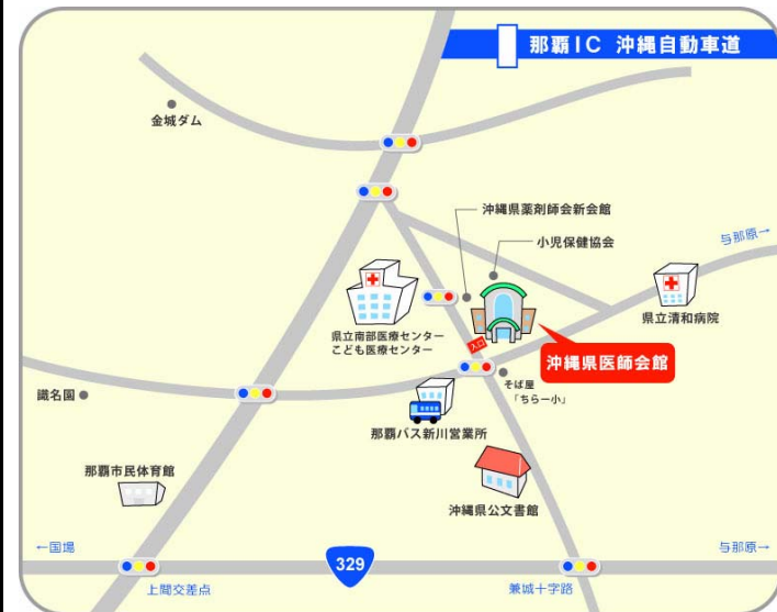
～セミナー会場～ 沖縄県医師会館